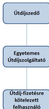
1. ábra - Útdíjszedő, az Egyetemes Útdíjszolgáltató és az Útdíj-fizetésre kötelezett felhasználó közötti szerződéses viszony

Az Útdíjszedő, az Egyetemes Útdíjszolgáltató és az Útdíj-fizetésre kötelezett felhasználó közötti szerződéses viszony az alábbi ábra szemlélteti: